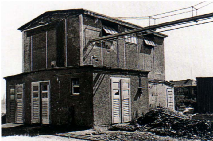
Erstes Silicone-Produktionsgebäude von WACKER in Burghausen (1949) (ehemals Wacker-Chemie)