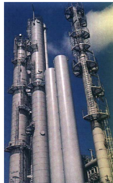
Silandestillation bei WACKER im Werk Burghausen (heute)